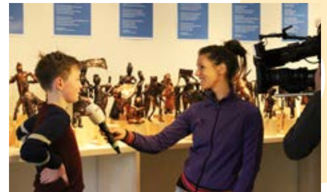
Het Jeugdjournaal besteedde aandacht aan een kleine entreehal-expositie van door scholieren gemaakte standbeelden geïnspireerd op De Dokwerker. Het was één van de activiteiten rondom de 75 ste herdenking van de Februaristaking.

Weerstanders , fototentoonstelling uit 2008 met portretten van Belgische verzetsstrijders, werd in 2016 uitgeleend voor een tentoonstelling in het Belgische Roeselare en trok daar van 29 september tot 4 december 1.260 bezoekers.