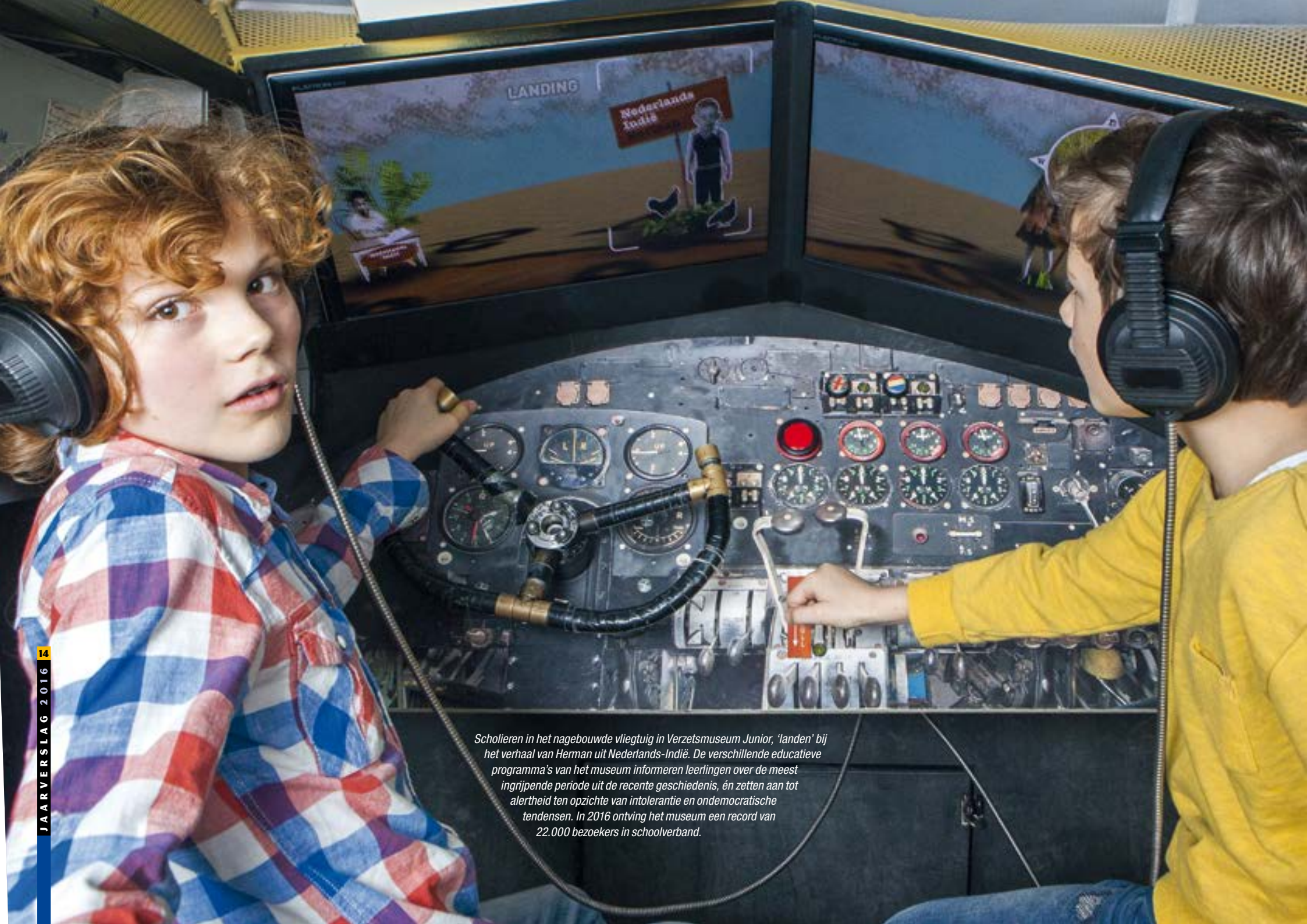
Scholieren in het nagebouwde vliegtuig in Verzetsmuseum Junior, 'landen' bij het verhaal van Herman uit Nederlands-Indië. De verschillende educatieve programma's van het museum informeren leerlingen over de meest ingrijpende periode uit de recente geschiedenis, én zetten aan tot alertheid ten opzichte van intolerantie en ondemocratische tendensen. In 2016 ontving het museum een record van 22.000 bezoekers in schoolverband.