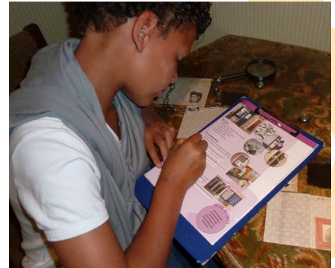
De B-opdracht (voor leerlingen vanaf een jaar of 14) werd in 2011 geheel vernieuwd en na een uitgebreide testfase met succes in gebruik genomen.