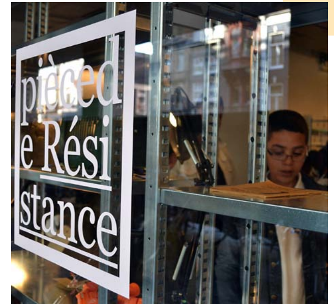
Het Verzetsmuseum stelde veel collectie beschikbaar voor de tentoonstelling Pièce de Résistance van het Amsterdamse 4 en 5 mei Comité in het gebouw van Mediamatic Bank aan de Vijzelgracht in Amsterdam.

De vorig jaar gesignaleerde toename van de raadpleging van de kleine, gespecialiseerde bibliotheek, die vooral door vrijwilligers wordt gerund, zette zich door in 2011. Ruim vijftig onderzoekers werden in de bibliotheek ontvangen. Voorts werden er weer honderden telefonisch of per e-mail ontvangen informatieverzoeken door de bibliotheekmedewerkers afgehandeld.