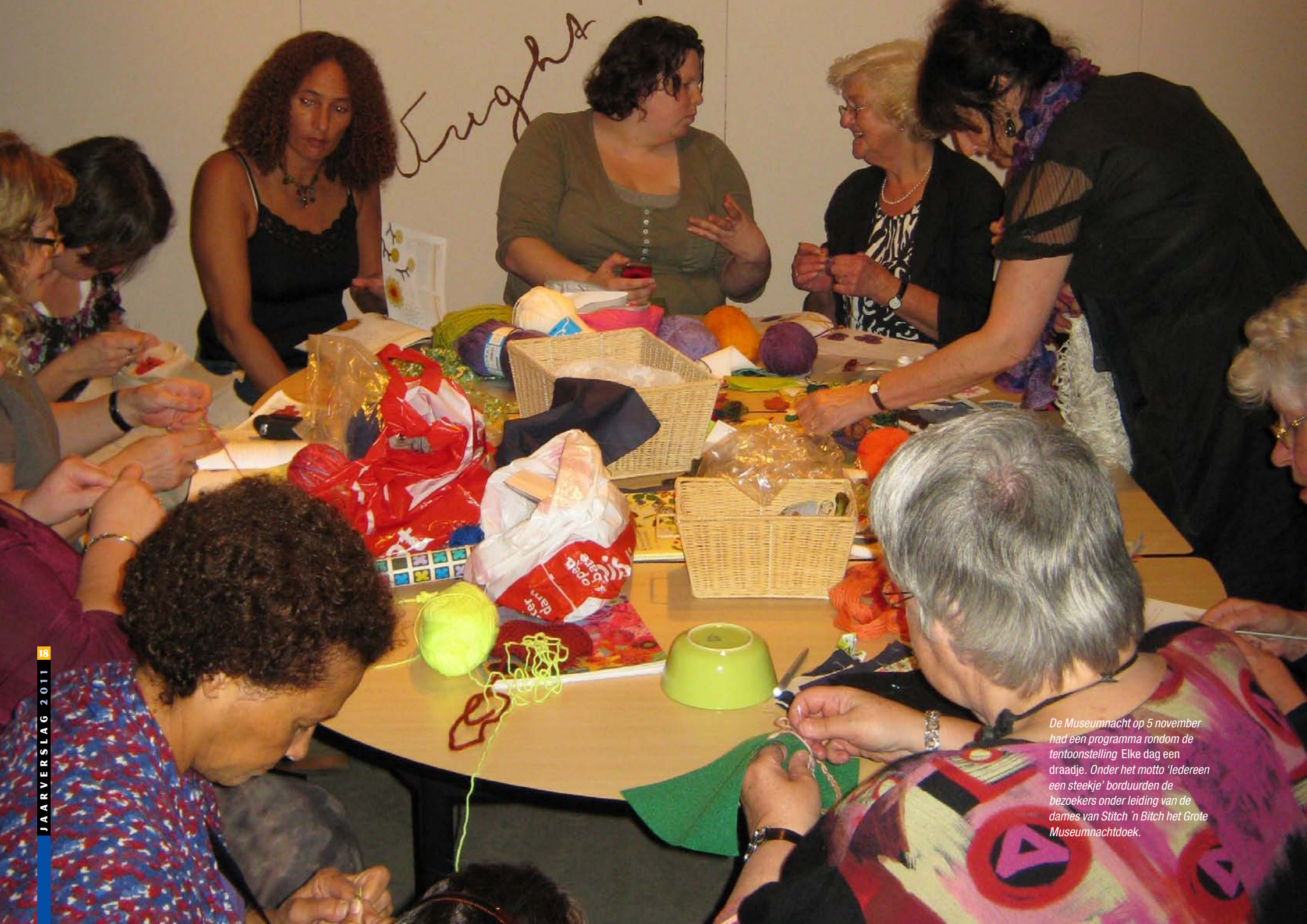
De Museumnacht op 5 november had een programma rondom de tentoonstelling 'Elke dag een draadje'. Onder het motto 'Iedereen een steekje' borduurden de bezoekers onder leiding van de dames van Stitch 'n Bitch het Grote Museumnachtdoek.