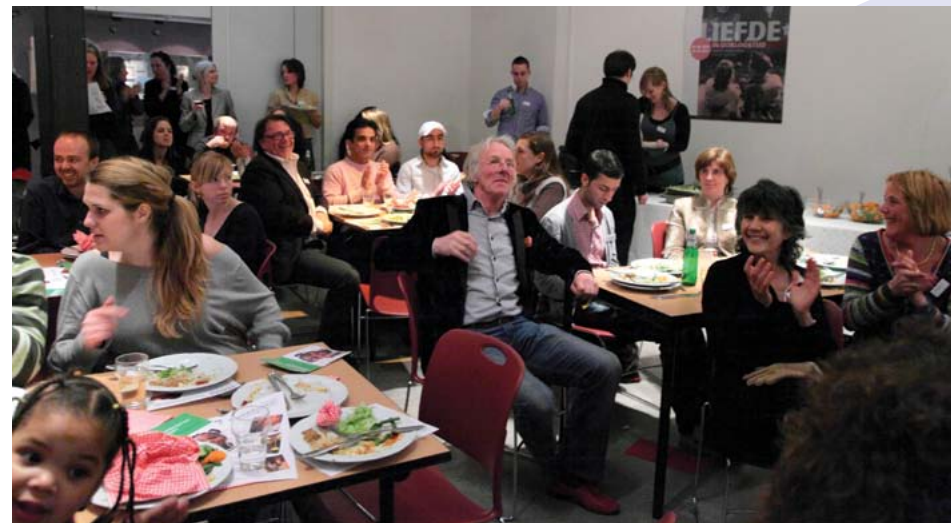
Bekende Nederlanders en politici verschaften tijdens de Nacht van de Vervanging één nacht onderdak aan vluchtelingen. Alle betrokkenen dineerden en ontbeten op 17 en 18 maart in het Verzetsmuseum.