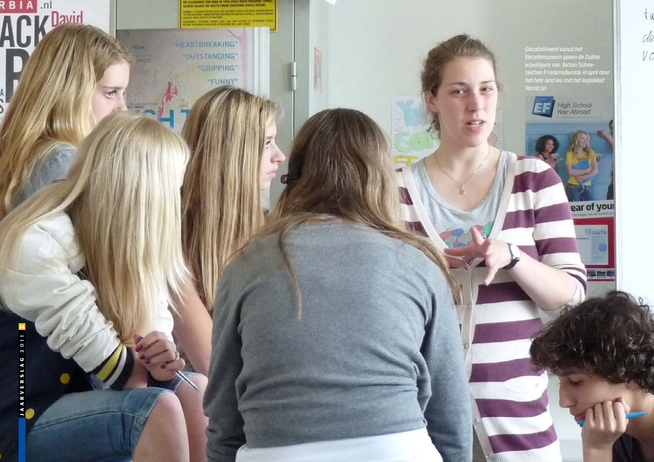
Gecoördineerd vanuit het Verzetmuseum gaven de Duitse vrijwilligers van Aktion Sühnezeichen Friedensdienste in april door het hele land les met het lespakket Verzet je!

EF High School Year Abroad Fear of you I bet maak wat de wereld je